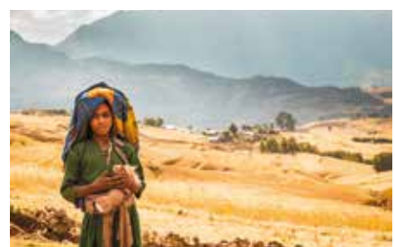
© Hervé Doulat et Éric Collet

film d'Hervé Doulat et Éric Collet, 25' Le massif du Simien, dans le nord de l'Éthiopie, est un parc national inscrit au patrimoine mondial de l'UNESCO. Avec ses hauts plateaux à plus de 4000 m d'altitude, il est appelé le "Toit de l'Afrique". Malgré les conditions de vie difficiles et l'isolement extrême, de nombreux habitants vivent sur ses contreforts en quasi-autarcie et dans les conditions du Moyen Âge européen... Des centaines de trekkers le parcourent avec bonheur chaque année, appréciant ses incroyables paysages et la fière hospitalité de sa population. Pour deux d'entre eux, la découverte s'est transformée en vocation : venir en aide et construire une école.