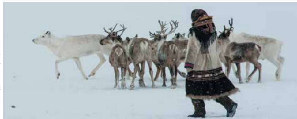
© Maurice Thiney, Fred Cebron, Jacques Ducoin

11 h 30 Tour du monde avec Jean-Claude Bossard, 60'